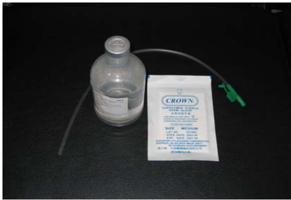
圖二：無菌單隻手套、生理食鹽水、抽痰管