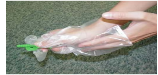
圖八：將手套包住抽痰管