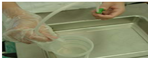
圖七：抽吸管置於清水清洗